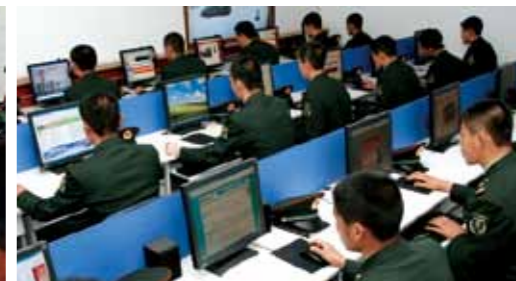
利用多媒体平台延伸教育课堂